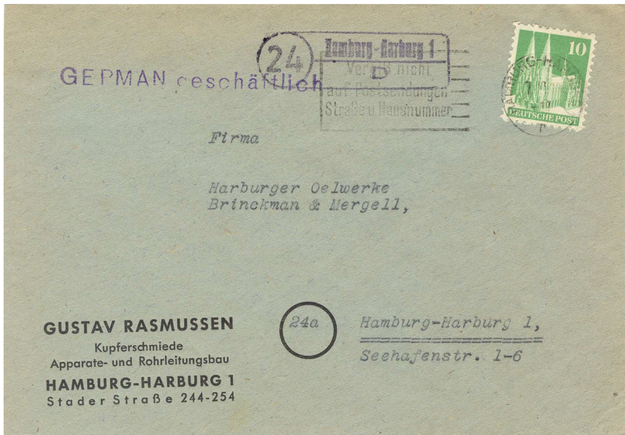
Stempel der Poststelle (II)-Stadt „Hamburg-Harburg 1 D“ vom 7.11.1948.