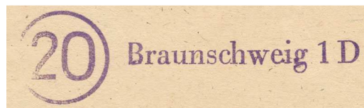
Stempel einer Poststelle (II) Stadt; hier Braunschweig 1 D

Ausnahmen hiervon waren für Poststellen (Stadt) nicht vorgesehen. Sie waren mit einem Gummistempel ausgerüstet, der den Namen der Poststelle (II) Stadt trug.