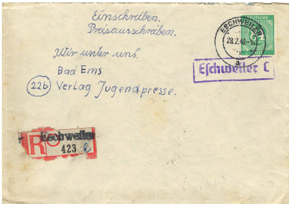
Poststelle (II)-Stadt-Stempel „Eschweiler C“ auf R-Brief vom 28.2.1948, Eschweiler. Der Stempel wurde auf dem Briefumschlag abgeschlagen; der R-Zettel weist nur den Stempel „Eschweiler“ auf.