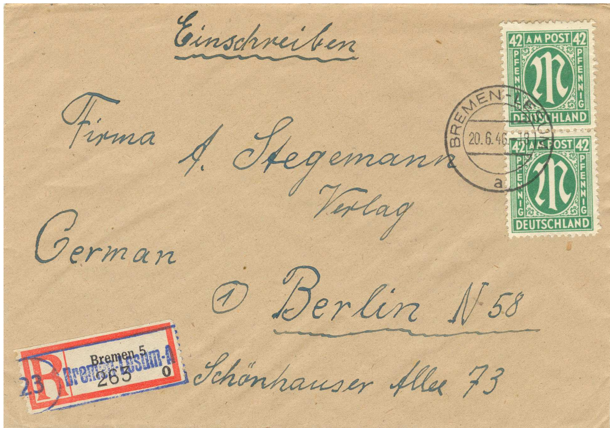
R-Brief der Poststelle (II) Stadt Bremen-Lesum A. Der R-Zettel des Postamtes Bremen 5 wurde mit dem Stempel „Bremen-Lesum A“ überstempelt. Die Entwertung erfolgte beim Postamt Bremen-Lesum.