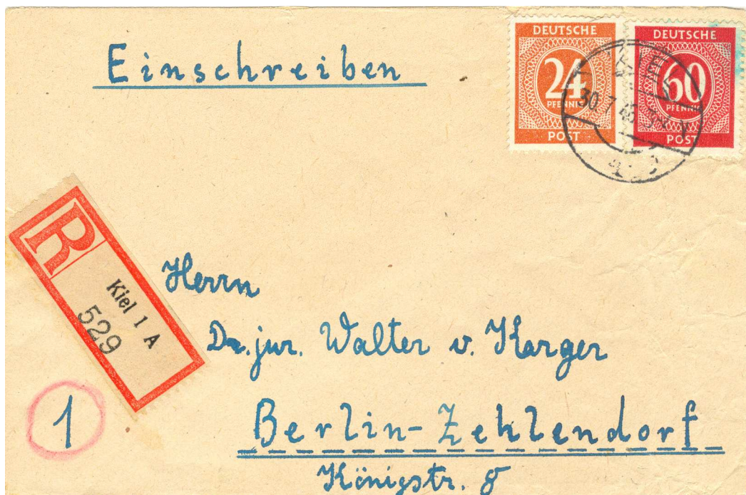
R-Brief der Poststelle (II) Stadt „Kiel 1 A“. Die Entwertung erfolgte am 30.7.46 durch den Tagesstempel Kiel 4 –c. Postsendungen der Poststelle (II) Stadt Kiel 1 A wurde aufgrund der Kriegsschäden beim Postamt Kiel 1 nach Kriegsende bis Ende 1946 vorübergehend auf das Zweigpostamt Kiel 4 abgeleitet.